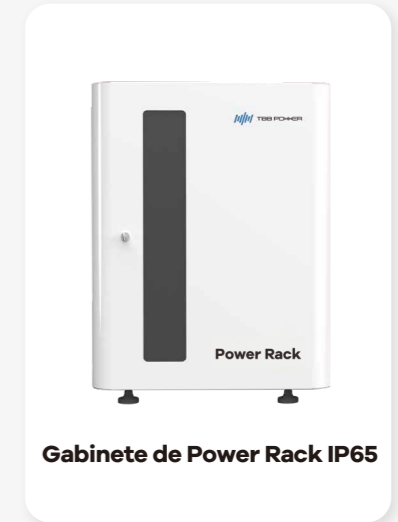
Gabinete de Power Rack IP65